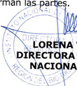
LORENA VILLA VALENZUELA DIRECTORA REGIONAL INSTITUTO NACIONAL DE ESTADÍSTICAS