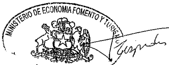
LUIS FELIPE CESPEDES MINISTRO DE ECONOMÍA, FOMENTO Y TURISMO